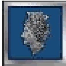
Crédit du Léman